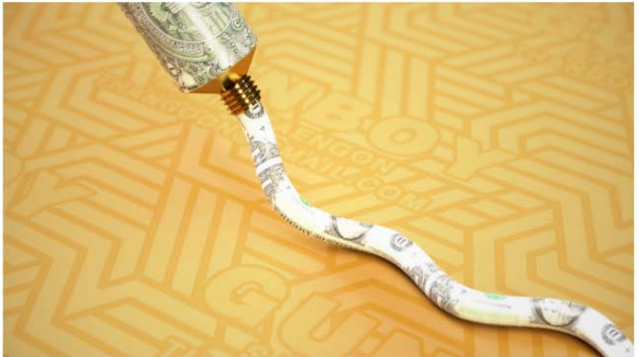
ภาพนิ่งจาก "Oddly Satisfying" 3D Short Animation ผลงานของสมิทธิ์ ในนิทรรศการ The Flyby of Comets

Arspiration: อยากให้ทั้งคุณสมิทธิ์และคุณสิริพงศ์พูดถึงผลงานที่นำมาแสดงที่ The Flyby of Comets นี้ และในครั้งต่อไปที่จะจัดแสดงที่ Los Angeles ปีหน้าจะเป็นอย่างไรคะ?