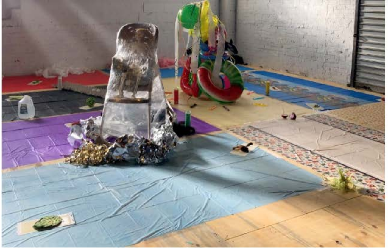
หนึ่งในผลงาน Art Installation ในนิทรรศการ The Flyby of Comets